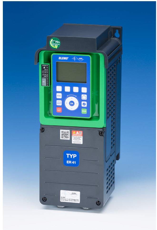
Version K in Schutzart IP21

Frequenzumrichter zur Drehzahlverstellung von DS-Asynchronmotoren und Synchronmotoren 0,75 bis 800,0 kW 380 bis 480 V, 3~ Schutzart IP21 bis IP55