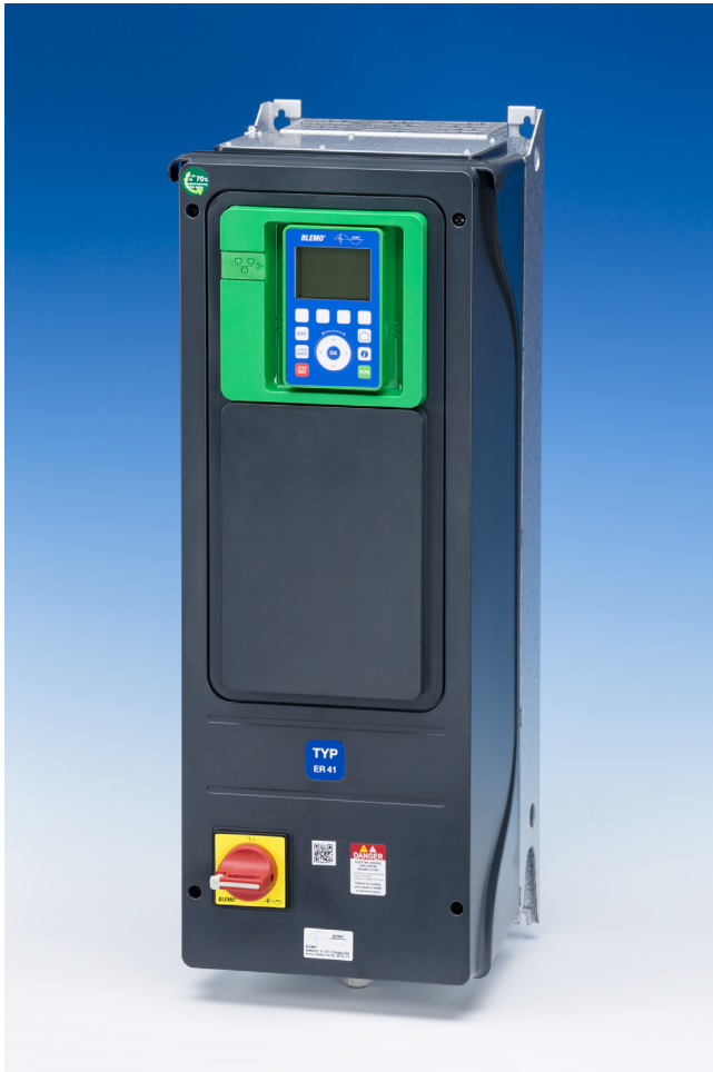
Version G-V2 in Schutzart IP55 mit Lasttrennschalter