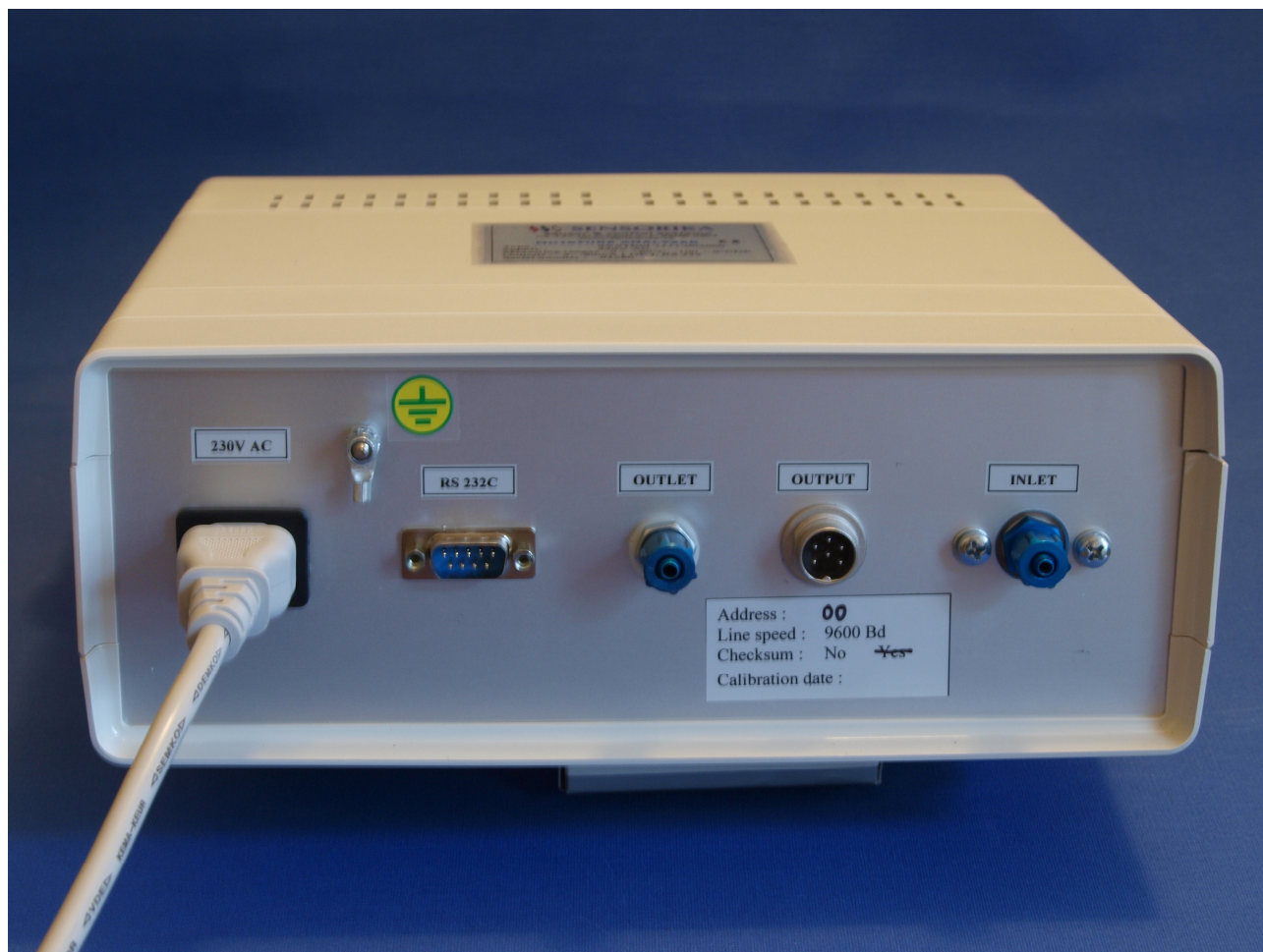
Analysátor vlhkosti SYSTEM 1311 Pohled na zadní stranu se šroubeními Festo