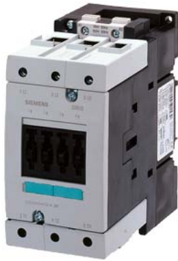
接触器 220 V AC 50/60 HZ AC3 37 kW 400 V 3 极，规格 S3 螺丝端子